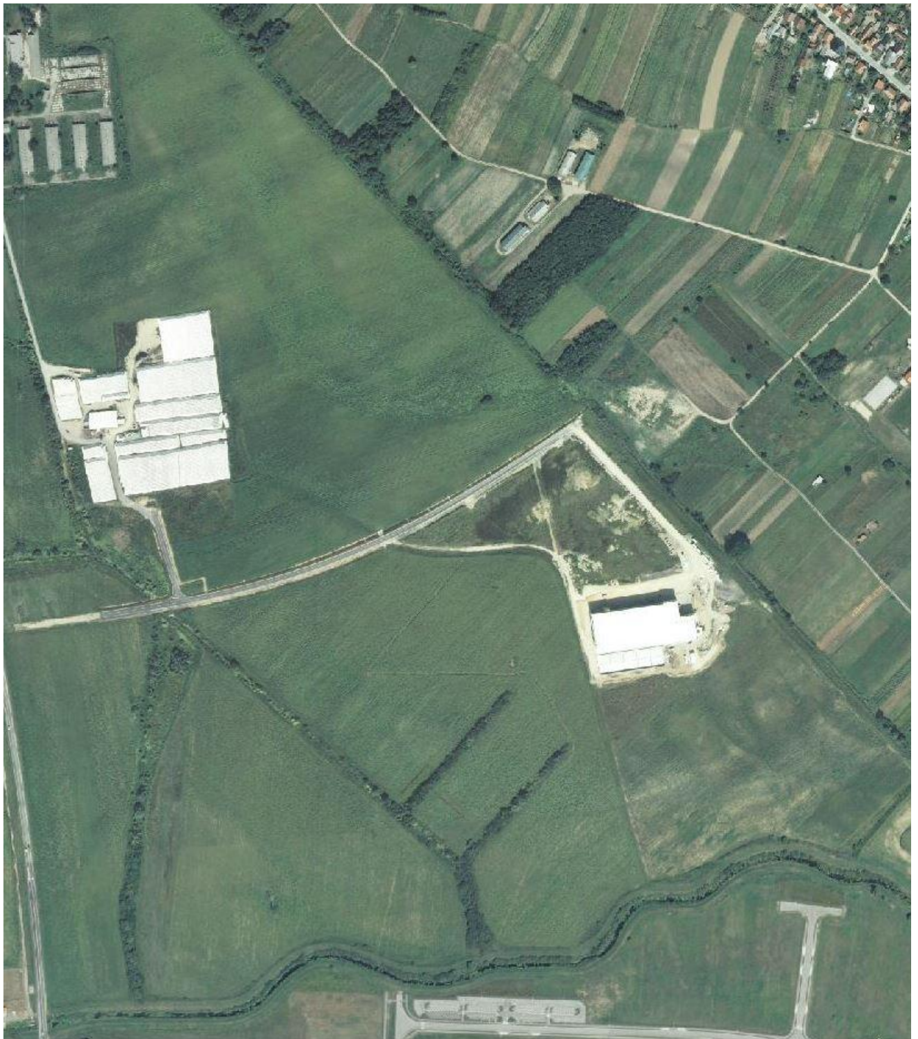
Slika 1. Orto-foto karta s prikazom lokacije postrojenja i područja koje ga okružuje