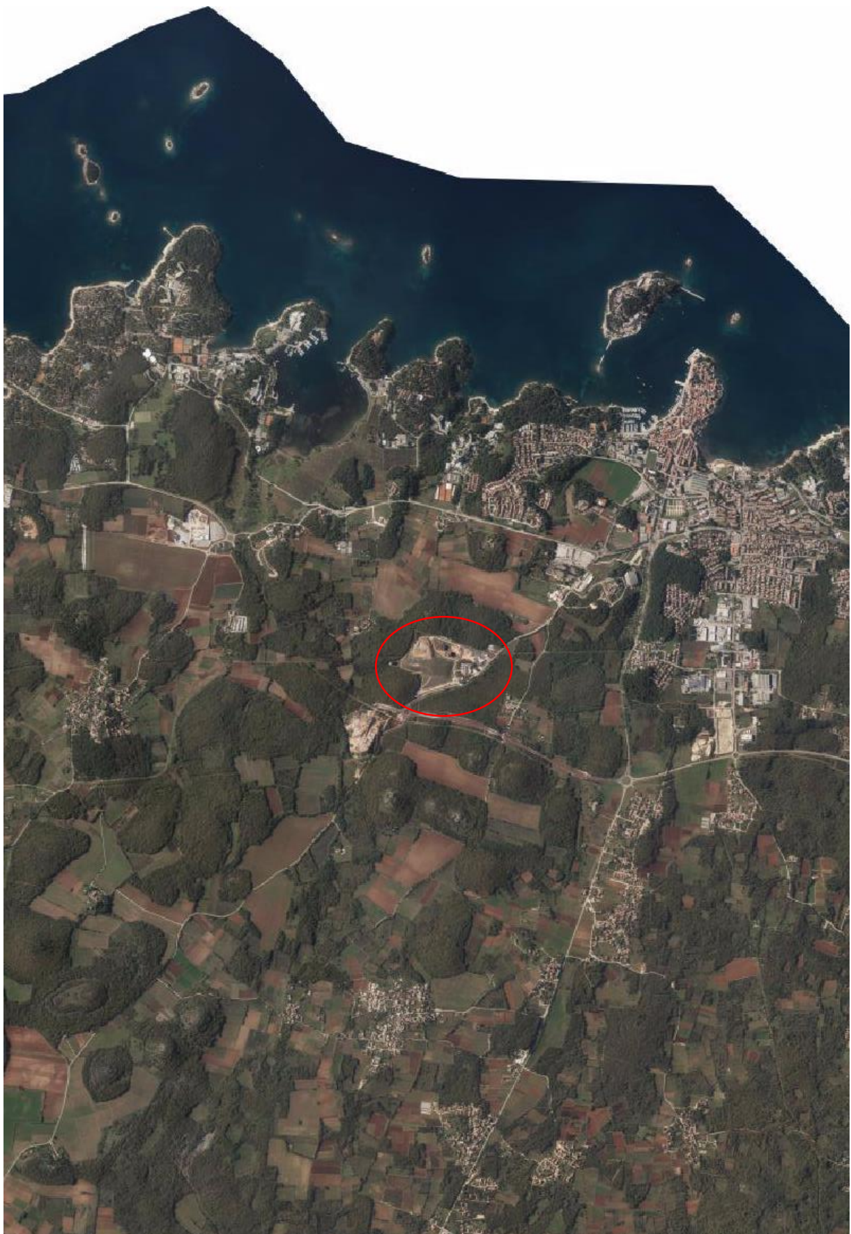
1. Orto-foto karta šireg područja odlagališta "Košambra"